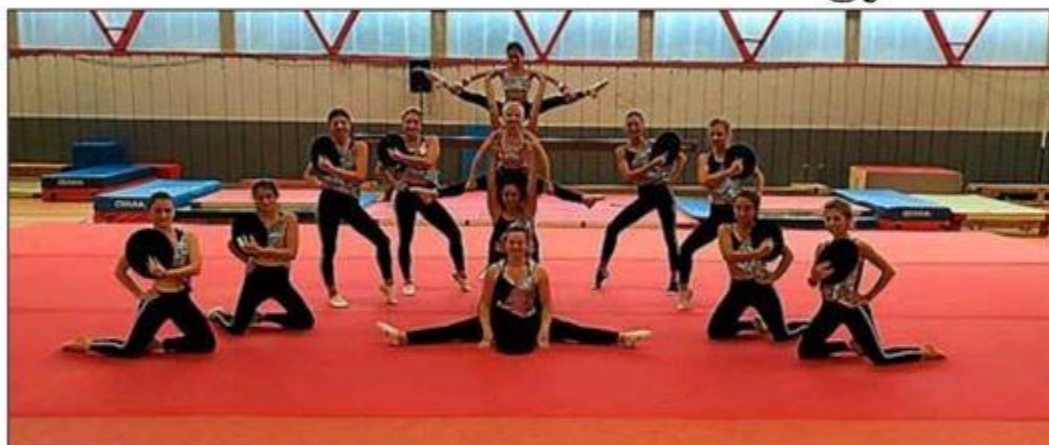
► Beau gala de fin d'année avec un nombreux public.