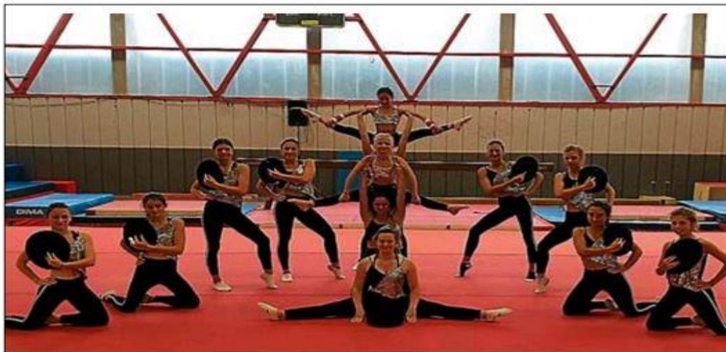
► Les cours de gym sportive reprendront le 2 septembre prochain au gymnase.

Les inscriptions de la Gymnastique sportive Quillan auront lieu, le mercredi 28 août , de 14 à 18 heures, au gymnase municipal, dans la salle de gym au 1 er étage. Deux cours gratuits avant de s'inscrire. Mathieu Gabignaud s'occupera des petits bouts de 3 et 4 ans. Stéphanie Gabignaud aura à sa charge les gymnastes de 6 à 10 ans, des Gym éveil 2 e année et des gymnastes confirmées. Charlotte Brancato, quant à elle, s'occupera des gymnastes à partir de 11 ans. Les cours débuteront le lundi 2 septembre . « Cette année le club va fêter ses 40 ans, une fête de Noël est prévue ainsi qu'un gala de fin d'année », annonce Stéphanie Gabignaud. Le club compte une centaine de licenciés. La discipline pratiquée est la gymnastique artistique féminine (saut, barres, poutre et sol) alors comme l'indique la responsable : « Si tu aimes faire des acrobaties, sauter, tourner, avoir la tête en bas, t'amuser tout en entraînant pour réussir ; inscris-toi au club de Gymnastique sportive Quillan le mercredi 28 août de 14 à