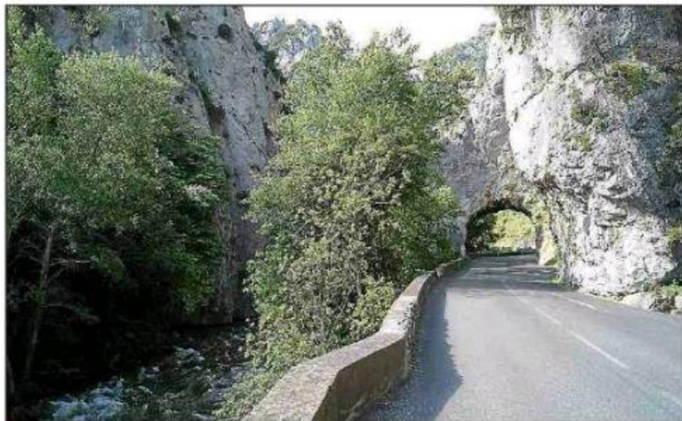
► Un belvédère présentera une vue d'ensemble sur le Trou du Curé.

Les communes de Quillan et Belvianes envisagent donc de rassembler leur énergie pour l'entretien et la valorisation du chemin qui relie les deux communes vers les gorges de la Pierre-Lys. Les communes précitées ont donc proposé la mise en place d'une entente intercommunale. Les acteurs se sont donc retrouvés, jeudi 3 no-