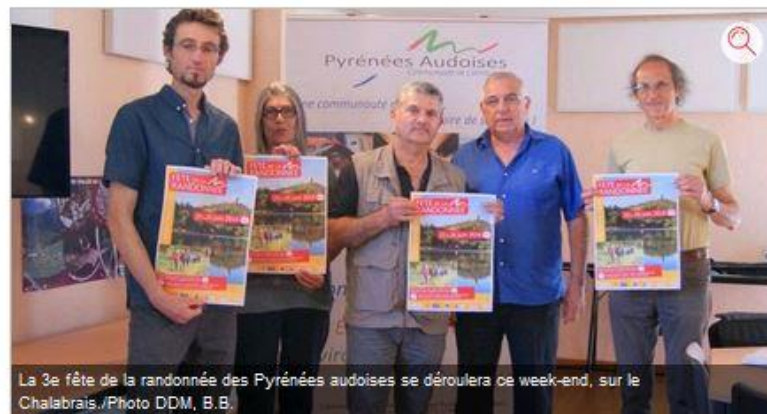
La 3e fête de la randonnée des Pyrénées audoises se déroulera ce week-end, sur le Chalabrais.