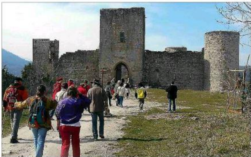
► Puivert accueillera une grosse partie de l'événement cette année.